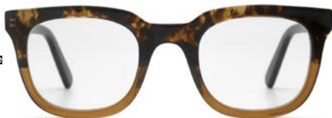
Ace & Tate

ACE & TATE , STEENHOUWERSVEST 15, 2000 ANTWERPEN, WWW.ACEANDTATE.COM